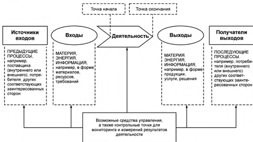
Рисунок 1 — Схематичное изображение элементов процесса

Рисунок 1 дает схематичное изображение любого процесса и иллюстрирует взаимосвязь элементов процесса. Контрольные точки мониторинга и измерения, необходимые для управления, являются специфическими для каждого процесса и будут варьироваться в зависимости от соответствующих рисков.